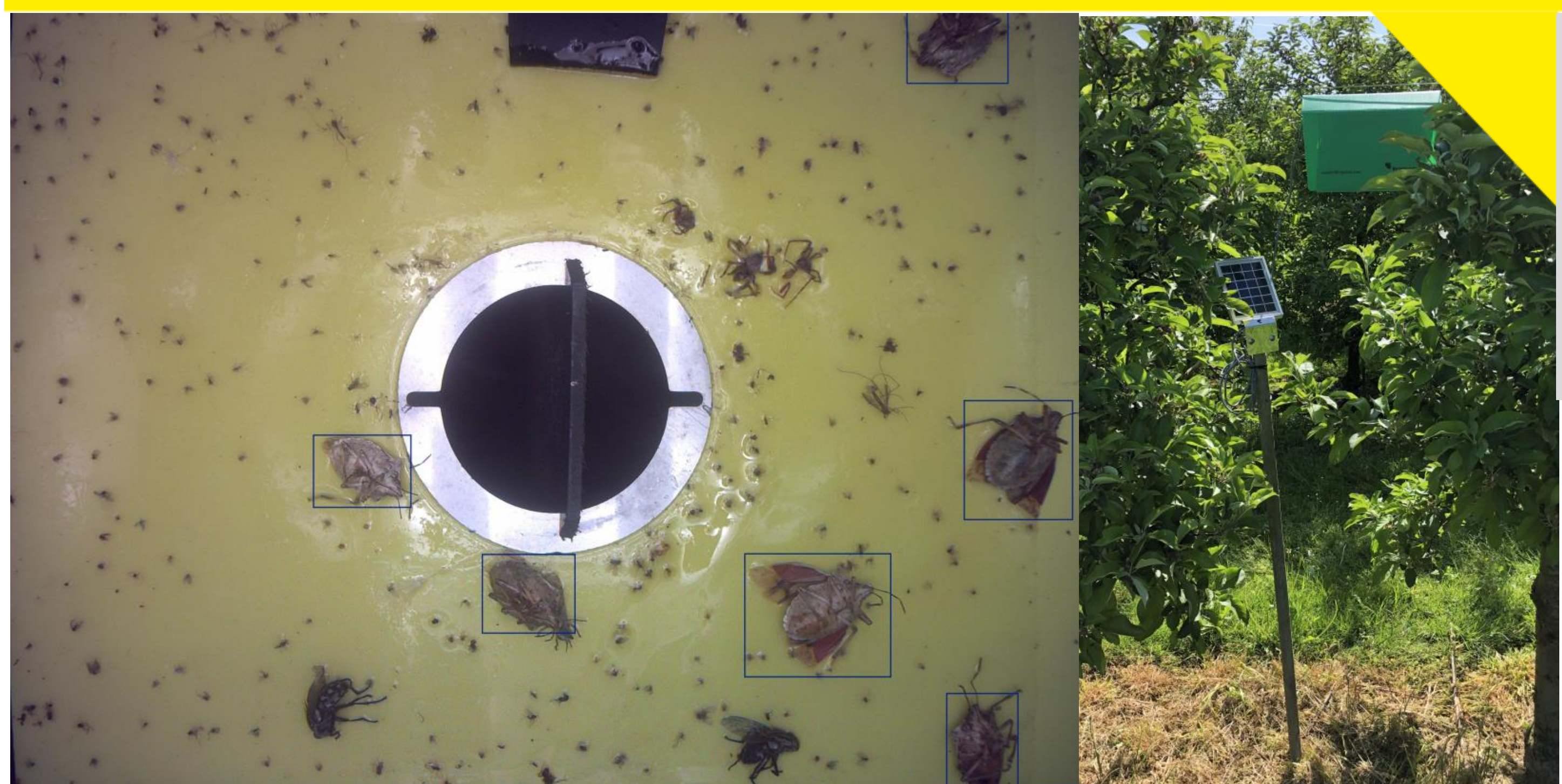
Kleiner Fruchtwickler Kümmertshausen